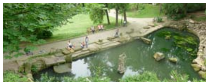
18 | Letní den s evropskými fondy