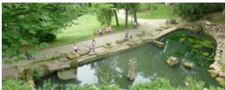
18 | Letní den s evropskými fondy