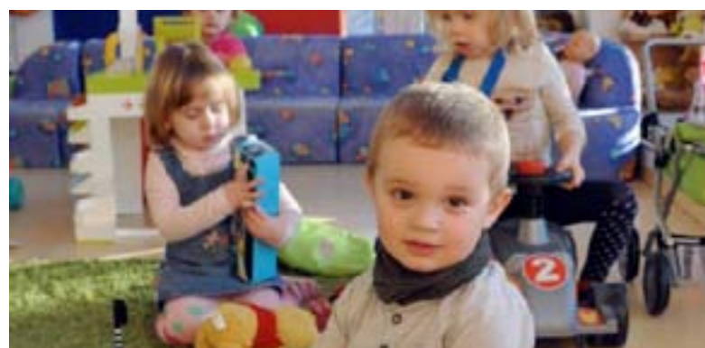
10 | Dětské skupiny

AKTUÁLNĚ Schválení projektů v Zastupitelstvu hlavního města Prahy 3