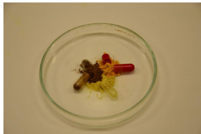
Tobolky budou obsahovat kombinaci účinných přírodních látek.

Na českém, ale i evropském trhu je velmi malý výběr podobných přípravků, navíc jsou drahé, takže většina seniorů si je nemůže dovolit. Právě starším lidem však mohou výrazně pomoci. Jednou z nejčastějších příčin jejich úmrtí totiž bývá bakteriální a virová infekce. Důvodem je fakt, že se zvyšujícím se věkem klesá obranyschopnost organismu a zvyšuje se četnost projevů metabolických onemocnění. Výživa mnoha, často i nemocných seniorů totiž bývá špatná, což pro ně má horší důsledky než pro mladší lidi: snižuje se imunita, hybnost, soběstačnost a také se může zhoršit duševní zdraví. Doplňky stravy s vhodnou kombinací epigeneticky aktivních látek dokáží tento proces zpomalit.