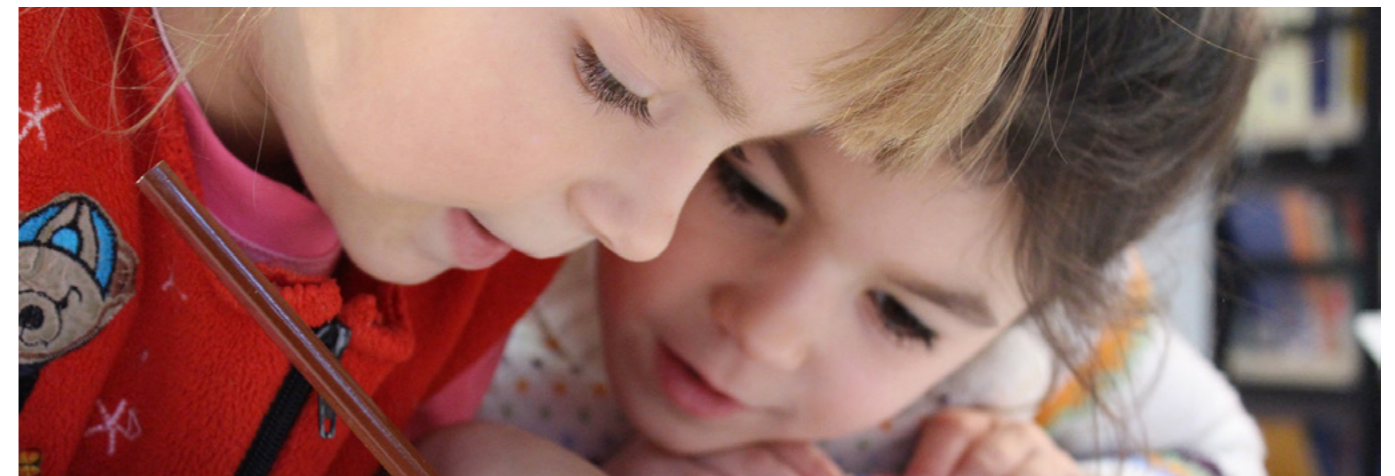
Evropské dotace jsou pro pražské školství významnou pomocí.

Zapomínat nesmíme ani na oblast robotizace či třeba technologie 3D tiskáren. Dnešní svět je digitální, proto je také velmi důležitým krokem nedávný start projektu prg.ai, kterým chceme Prahu zařadit mezi světové superhuby umělé inteligence. Zásadní roli, a to nejen v tomto projektu, hraje úzké propojení vědeckých a výzkumných pracovišť s vysokými, ale dnes už i středními školami a také s podnikatelským sektorem. Díky zaměření jedné ze svých oblastí nám pražský operační program pomáhá i s těmito investicemi.