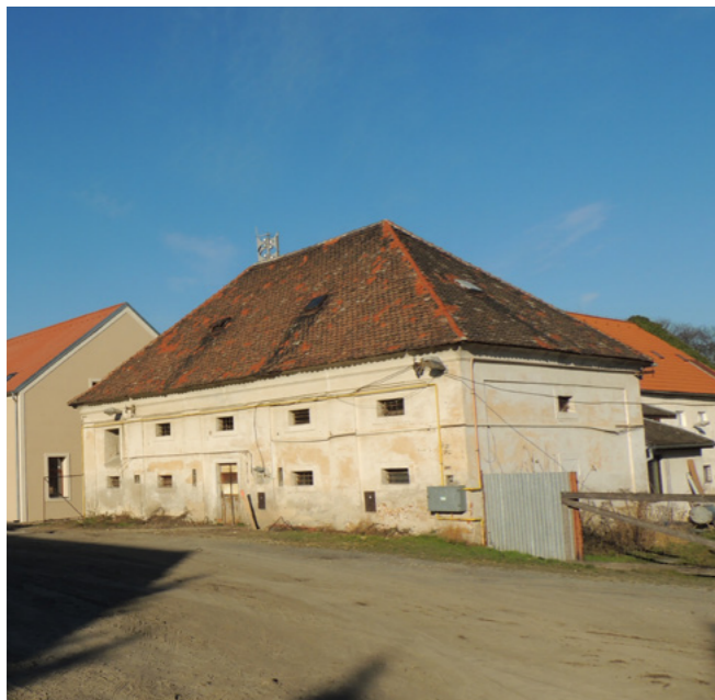
Barokní sýpka byla v neutěšeném stavu.

Už bezmála tři čtvrtě roku slouží obyvatelům pražských Satalic nové komunitní centrum, pojmenované po zdejším rodákovi, scénáristovi Jiřím Hubačovi. Někdejší hospodářská stavení získala nové využití a zchátralá sýpka dnes díky podpoře z pražského operačního programu září novotou a poskytuje zázemí pro aktivity lidí všech generací.