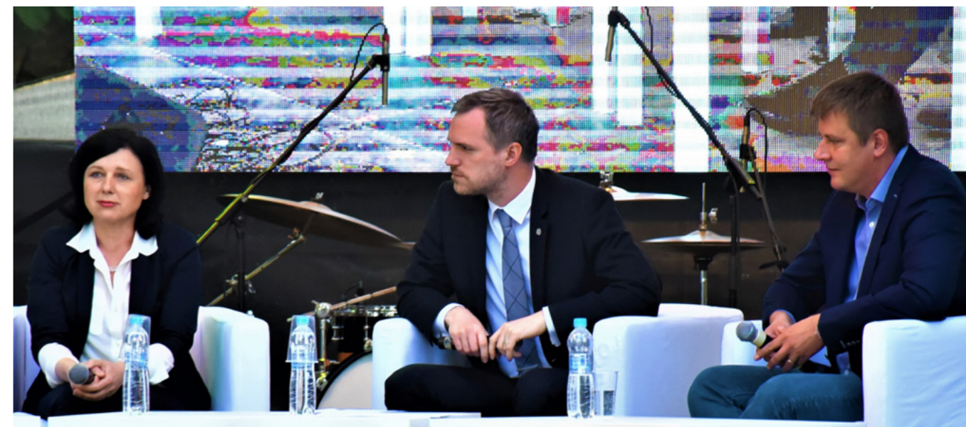
Oslav Dne Evropy se zúčastnil i pražský primátor Zdeněk Hřib.