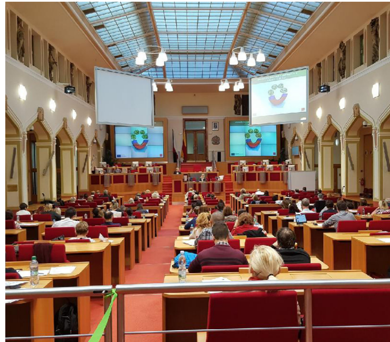
Seminářů se až dosud zúčastnilo přes tisíc zájemců o dotace.

Nejbližší seminář se uskuteční 19. června a jeho tématem je 37. výzva nazvaná Modernizace zařízení a vybavení pražských škol II, která se těší mimořádně vysokému zájmu žadatelů.