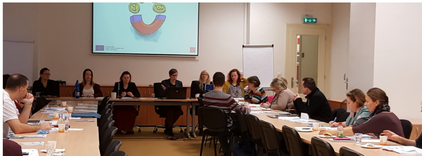
Od spuštění programu se uskutečnilo přes 150 seminářů.

Už více než 150 seminářů, školení, workshopů a podobných akcí uspořádal od počátku současného programového období EU magistrátní odbor evropských fondů ve snaze maximálně podpořit hladké fungování pražského operačního programu. I díky těmto aktivitám se jeden z nejmenších operačních programů v zemi těší vysokému hodnocení ze strany žadatelů a příjemců dotace. Možnosti získat touto formou co nejvíce informací jich dosud využilo přibližně 1200.