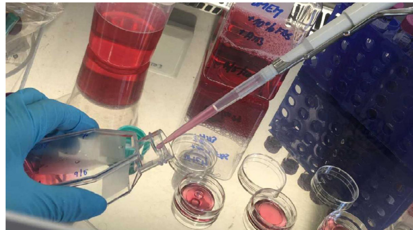
Unikátní prostředky vznikají v laboratořích 1. lékařské fakulty UK.

V rámci druhého z dílčích projektů univerzita vyvíjí prostředek na zvýšení imunity pro mladší lidi, jejichž imunitní systém potřebuje podpořit, například pacienty v nemocnicích, zdravotníky či školské zaměstnance. I zde půjde o tobolky plněné sypkou směsí několika přírodních látek. Rovněž tento prostředek bude v podobě funkčního vzorku připraven na konci letošního roku.