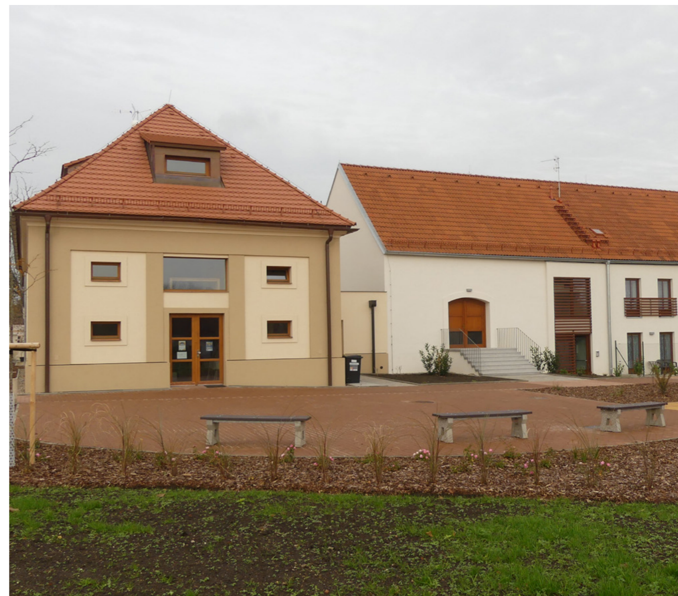
Celý areál nyní září novotou.