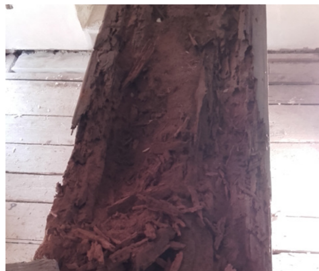
Při renovaci se podařilo zachránit i většinu původních dřevěných trámů.

„Satalicím chybělo místo, kde by bylo možné pořádat různé akce pro děti i dospělé. Postrádali jsme přirozené centrum, kde by se mohli scházet lidé, včetně sociálně a zdravotně znevýhodněných, které by poskytovalo prostor pro menší i větší akce a kde by se všichni cítili dobře. Tuto šanci skýtal právě starý statek a původně