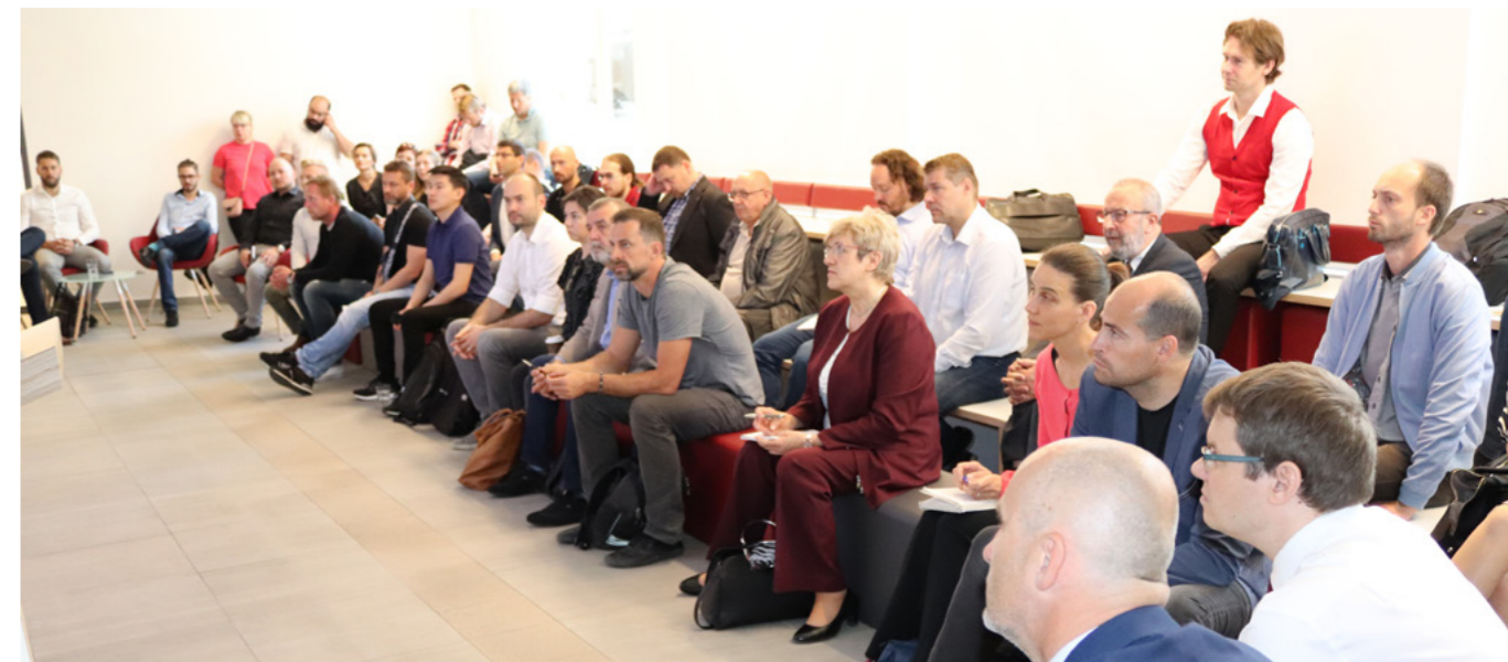
O informace o bezúročném úvěvu je velký zájem.