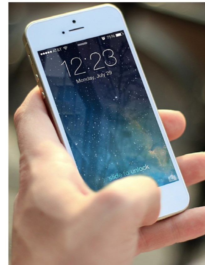
Výsledky projektu by se už brzy mohly objevit na trhu.