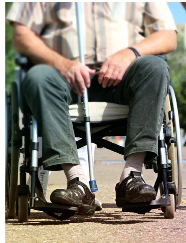
Mezi těmi, kteří nové přípravky uvítají, jistě budou i vozíčkáři.

Vysoký krevní tlak má v ČR zhruba 40 procent obyvatel ve věku mezi 25 a 64 lety, přičemž čtvrtina z nich o tom vůbec neví. Hypertenze je přitom jedním z nejzávažnějších rizikových faktorů kardiovaskulárních onemocnění. S rostoucím věkem její výskyt stoupá - vysoký tlak má 72 procent mužů a 65 procent žen mezi 55 a 64 lety.